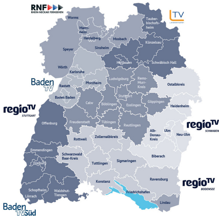
Abbildung 1: Sieben Regionalsender bilden die Kombi TV Baden-Württemberg